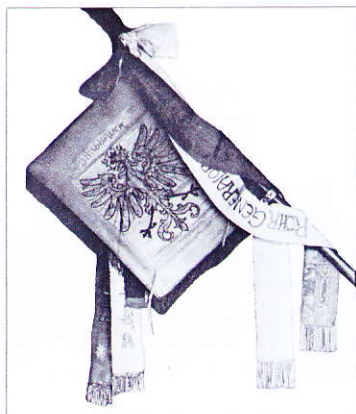
Abbildung aus dem Buch „Kaiserjäger-Ruhm und Ende“