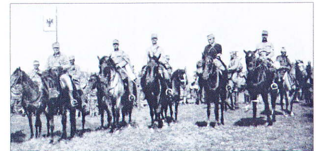
Stab des 1. Regiments beim Überschreiten der russischen Grenze