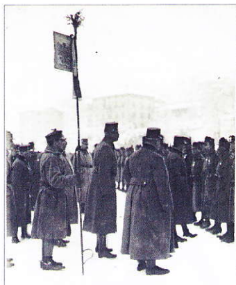
Kaiser Karl I., Besuch in Trient, bei den Tiroler Kaiserjägern am Waffenplatz, Standarte

24. Juli 1915, Feldmesse am Hauptplatz von Gries bei Bozen anlässlich der Vereini- gung des X. Marsch-Baons des 1. Regiments mit den aus Galizien zurückgekehr- ten Feldregiment.