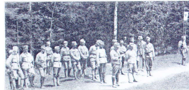
13. Juni – Einweihung der neuen Regimentsstandarte in Anwesenheit des eingetroffenen X. MarschBaon und der Reserven. Rechts auf dem Bild die Standarte mit dem Tiroler Adler.